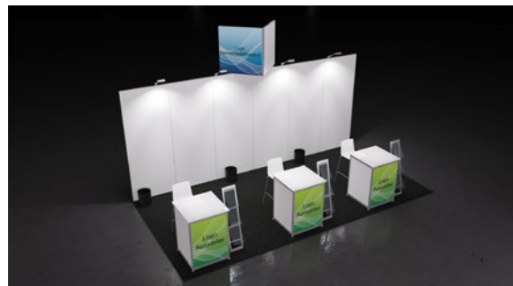
Musterbeispiel. Änderungen vorbehalten